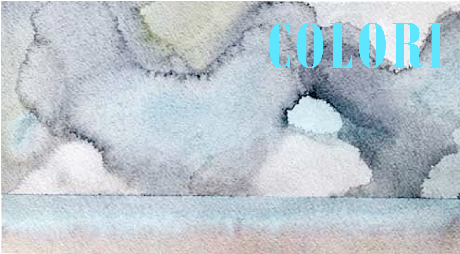
Michieletto, Colori da temporale 13