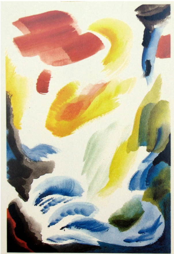
Michieletto da Lanuvio, I colori che mi mancavano , 1996, acquerello, 25x35