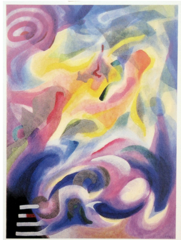
Michieletto da Lanuvio, Self-portrait , 1993 acquerello, 56x75