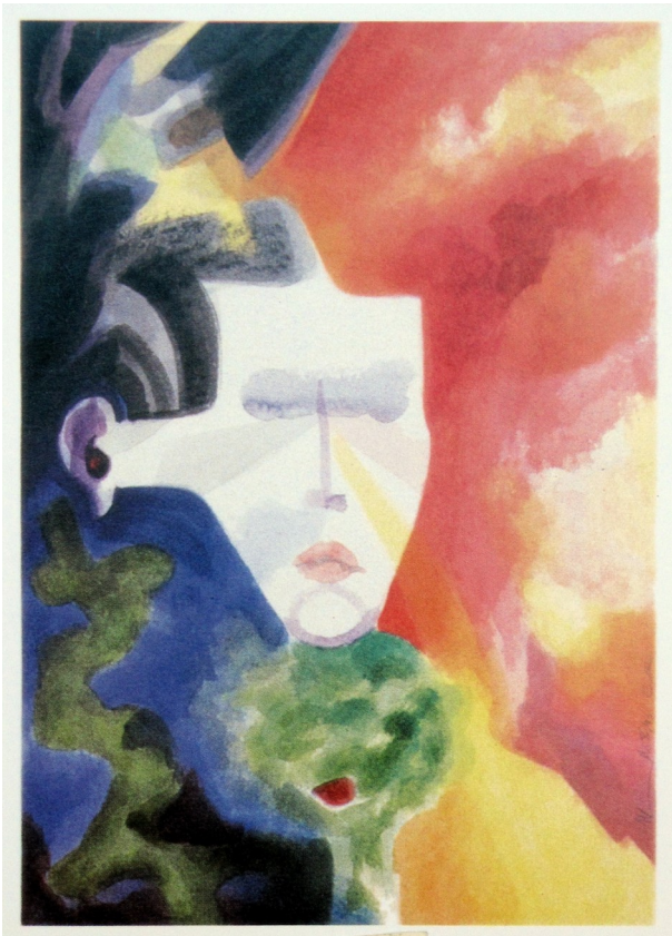
Michieletto da Lanuvio, Eva , 1993 acquerello, 56x75